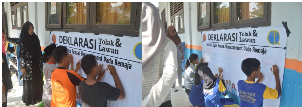
Gambar 3. Deklarasi Tolak & Lawan Kejahatan Seksual Pada Remaja Di Era Digital

Pelatihan psikoedukasi cyber sexual harrasement di era digital sangat penting karena psikoedukasi dapat mengenal kekerasan seksual dan mendorong perilaku positif di kalangan remaja (Qodariah et al., 2024). Psikoedukasi menjadi bagian dari strategi yang lebih luas yang melibatkan orang tua, pendidik, dan dukungan masyarakat untuk menciptakan jaring pengaman yang komprehensif bagi remaja di era digital. Kegiatan pendidikan interaktif, seperti lokakarya dan diskusi kelompok terfokus, dapat secara efektif melibatkan siswa dan meningkatkan pemahaman mereka tentang kekerasan seksual dan keamanan dunia maya (Sumarni et al., 2023). Dengan memanfaatkan platform digital untuk psikoedukasi dapat memperluas jangkauan dan aksesibilitas, seperti yang ditunjukkan oleh pengembangan situs web yang berfokus pada keamanan online (Symington & Dunn-Coetzee, 2015).