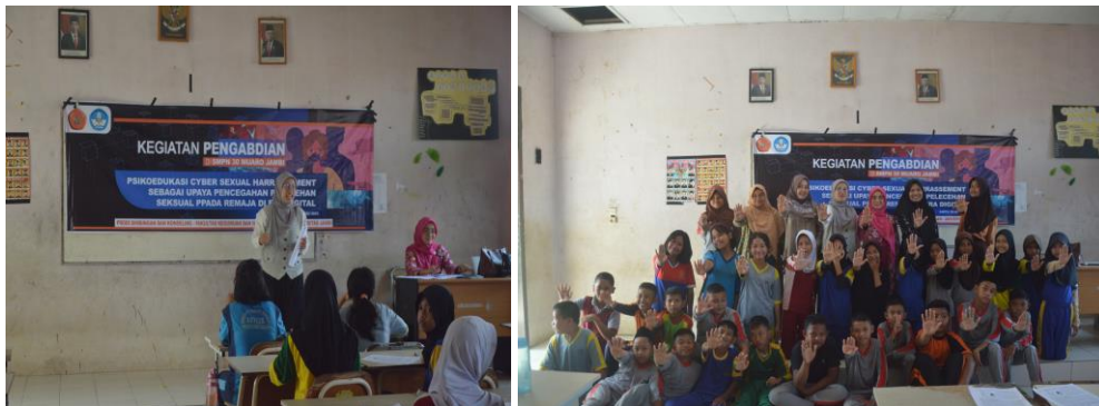
Gambar 2. Pelaksanaan Kegiatan Pelatihan Psikoedukasi cyber sexual harassment

Tahap pengakhiran. Pada akhir kegiatan pemateri memberikan kesimpulan hasil kegiatan layanan informasi berupa pelatihan psikoedukasi sebagai strategi pencegahan tindak kejahatan seksual di era digital yang sudah dilaksanakan. Pemateri bertindak sebagai model bagi peserta dalam menyampaikan kesimpulan hasil kegiatan secara lugas dan baik agar tidak menimbulkan konflik dalam kelompok. Pemateri mengatur peserta dalam menyampaikan kesimpulan hasil kegiatan agar masing-masing diantara mereka memiliki kesempatan yang sama. Hal ini bertujuan untuk menghindari dominasi dari salah satu anggota dalam kelompok sebelum mengakhiri kegiatan layanan, pemateri memberikan penilaian melalui pengungkapan pesan dan kesan secara lisan maupun tulisan dengan memfokuskan pada kondisi UCA ( undastanding, comfort, action ).